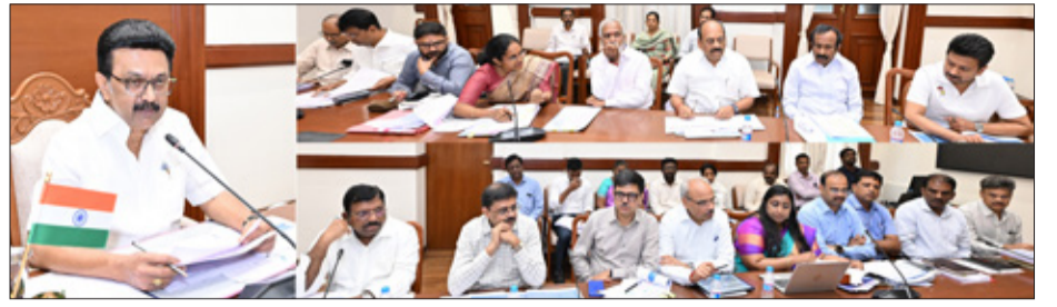
முதல்வர் மு.க.ஸ்டாலின் தலைமையில் நேற்று தலைமைச் செயலகத்தில், வீட்டுவசதி மற்றும் நகர்ப்புற வளர்ச்சித் துறையின் செயல்பாடுகள் குறித்த ஆய்வுக் கூட்டம் நடைபெற்றது. இக்கூட்டத்தில், துணை முதல்வர் உதயநிதி ஸ்டாலின் மற்றும் அரசு உயர் அலுவலர்கள் கலந்து கொண்டனர்.

வாஷிங்டன், ஜூலை 05- உக்ரைன் உடனான போரை ரஷ்ய அதிபர் விளாடிமிர் புதின நிறுத்துவார் என்று தோன்றவில்லை என்றும் அவர் விஷயத்தில் தான் ஏமாற்றம் அடைந்துள்ளதாகவும் அமெரிக்க அதிபர் டொனால்ட் ட்ரம்பின் தெரிவித்துள்ளார். கடந்த ஆண்டு நடைபெற்ற அமெரிக்க அதிபர் தேர்தல் பிரச்சாரத்தின்போது, நான் மீண்டும் ஆட்சிக்கு வந்தால் உடனடியாக உக்ரைன் - ரஷ்யா போரை நிறுத்துவேன்" என வாக்குறுதி அளித்தவர் டொனால்ட் ட்ரம்பின் இரண்டாவது முறையாக டொனால்ட் ட்ரம்பின் அதிபராக தேர்தெடுக்கப்பட்டு 6 மாதங்களுக்கு மேல் ஆகும் நிலையில், உக்ரைனுக்கு எதிரான ரஷ்யாவின் போர் தொடர்ந்து நடந்து கொண்டிருக்கிறது. மீண்டும் அமெரிக்க அதிபரானதில் இருந்து போரை முடிவுக்குக் கொண்டுவருவதற்காக டொனால்ட் ட்ரம்பின், விளாடிமிர் புதினுடன் 5 முறை தொலைபேசியில் பேச்சுவார்த்தை நடத்தினார். ஒவ்வொரு முறை பேச்சுவார்த்தைக்கும் பிறகும் மிகுந்த நம்பிக்கையை வெளிப்படுத்தி வந்த டொனால்ட் ட்ரம்பின், கடைசியாக கடந்த வியாழக்கிழமை நடந்த பேச்சுவார்த்தைக்குப் பிறகு முதல்முறையாக ஏமாற்றத்தை வெளிப்படுத்தி உள்ளார். விளாடிமிர் புதினுடனான தொலைபேசி பேச்சுவார்த்தை குறித்து வெள்ளிக்கிழமை (ஜூலை 4) அதிகாலை செய்தியாளர்களிடம் பேசிய டொனால்ட் ட்ரம்பின், "எங்கள் தொலைபேசி உரையாடல் நேரம் நடைபெற்றது. ஈரான் உட்பட பல்வேறு விஷயங்களைப் பற்றி நாங்கள் பேசினோம். உக்ரைனுடனான போரைப் பற்றியும் பேசினோம். ஆனால், போரை முடிவுக்குக் கொண்டுவருவதற்கான முயற்சிகளில் எந்த முன்னேற்றமும் ஏற்படவில்லை. இவ்விஷயத்தில் எனக்கு மகிழ்ச்சி இல்லை. விளாடிமிர் புதின விஷயத்தில் நான் ஏமாற்றம் அடைந்துள்ளேன். உக்ரைன் மீதான போரை அவர் நிறுத்துவார் என்று தோன்றவில்லை என்று தெரிவித்துள்ளார்.